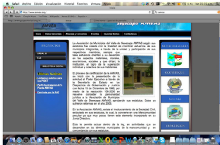
Figura 2. PORTAL DE LA MANCOMUNIDAD: WWW.AMVAS.ORG

ASOCIACIÓN DE MUNICIPIOS DEL VALLE DE SESECAPA